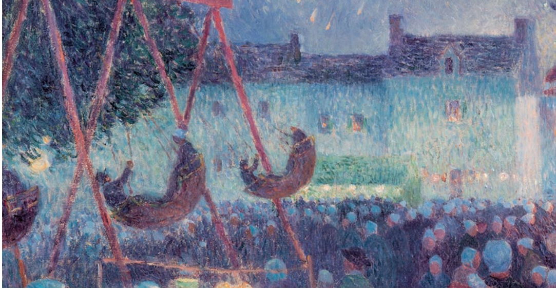
Ferdinand du Puigaudeau, Fiesta nocturna en Saint-Pol-de-Léon , ca. 1895.