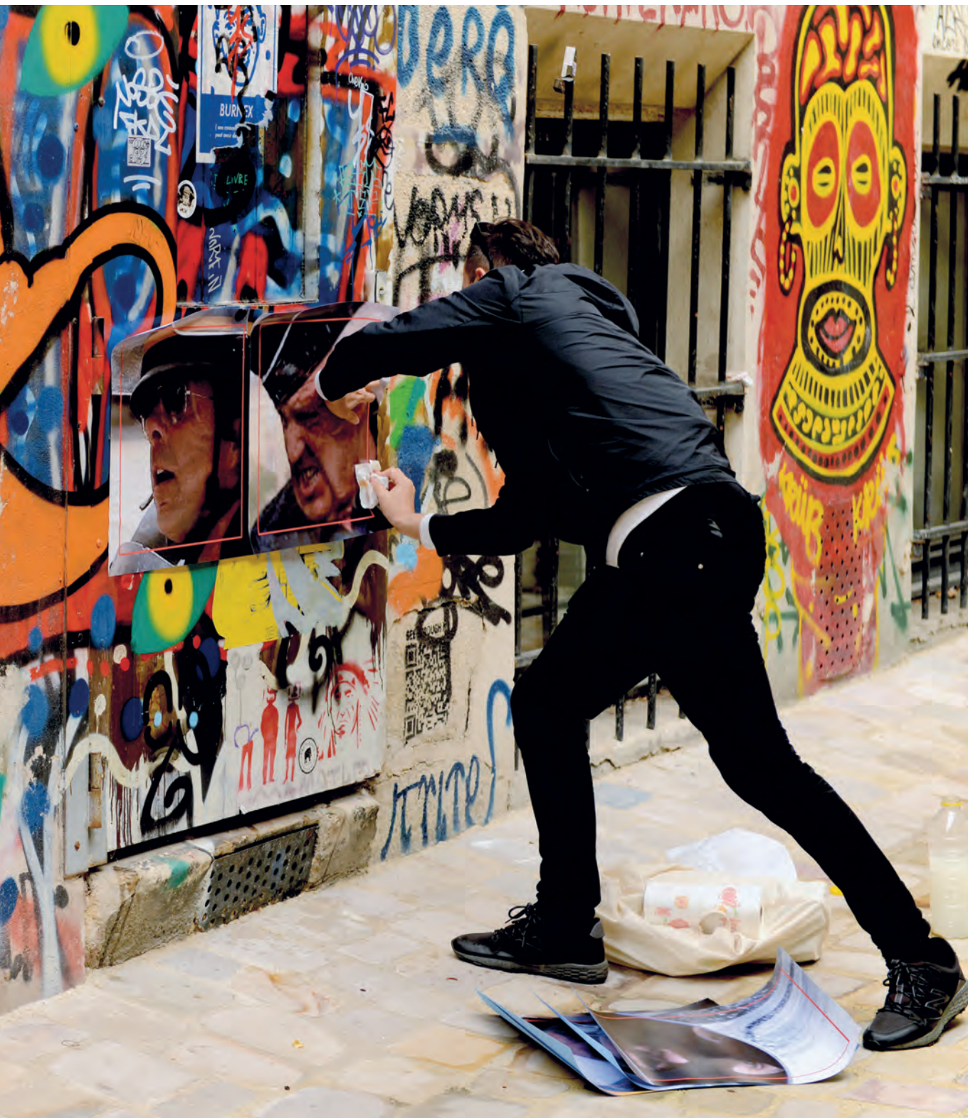
El artista en París pegando pósters de policías, 2020