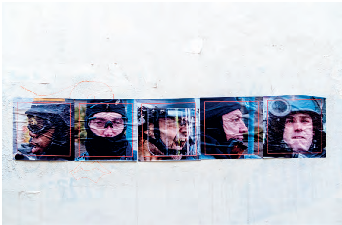
Pósters en París de policías, 2020