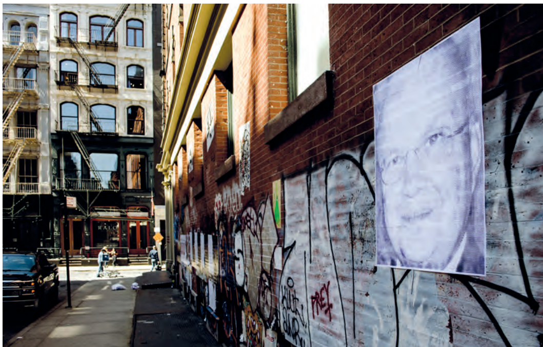
Pósters en una calle de Nueva York, 2016