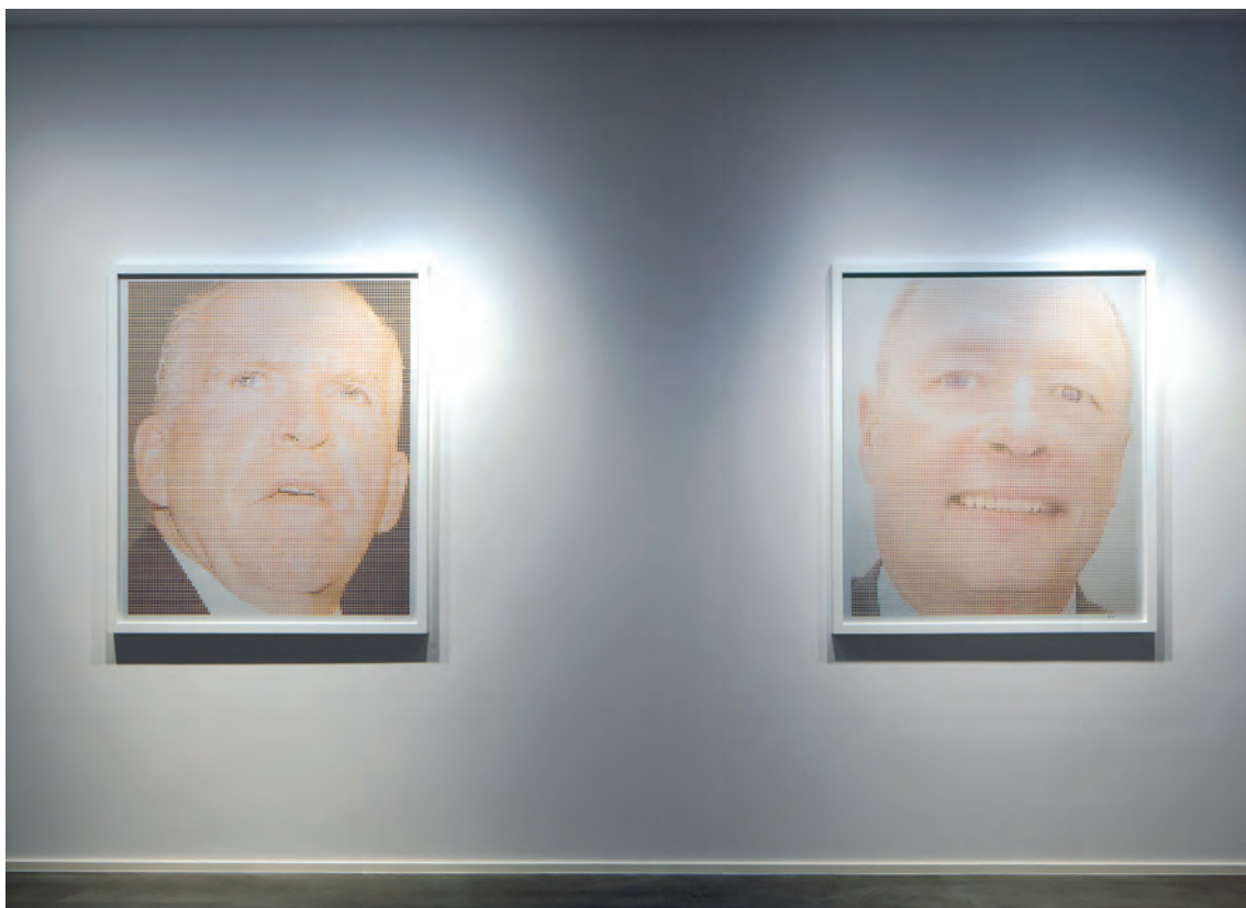
Paolo Cirio, Overexposed (Sobrexpuesto) 2015, Nome Gallery Berlín