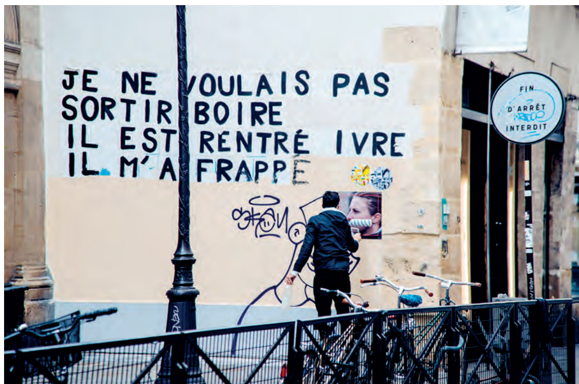
El artista en París pegando pósters de policías, 2020