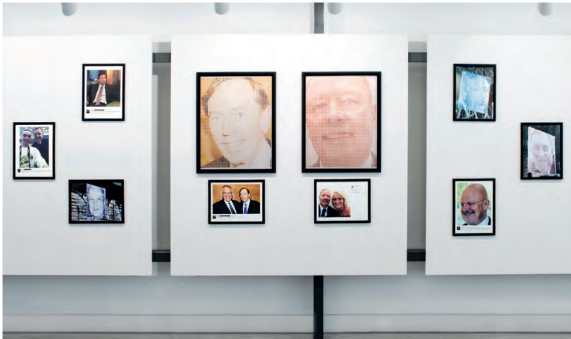
Paolo Cirio, Overexposed (Sobrexpuesto) , 2016, International Center of Photography Museum