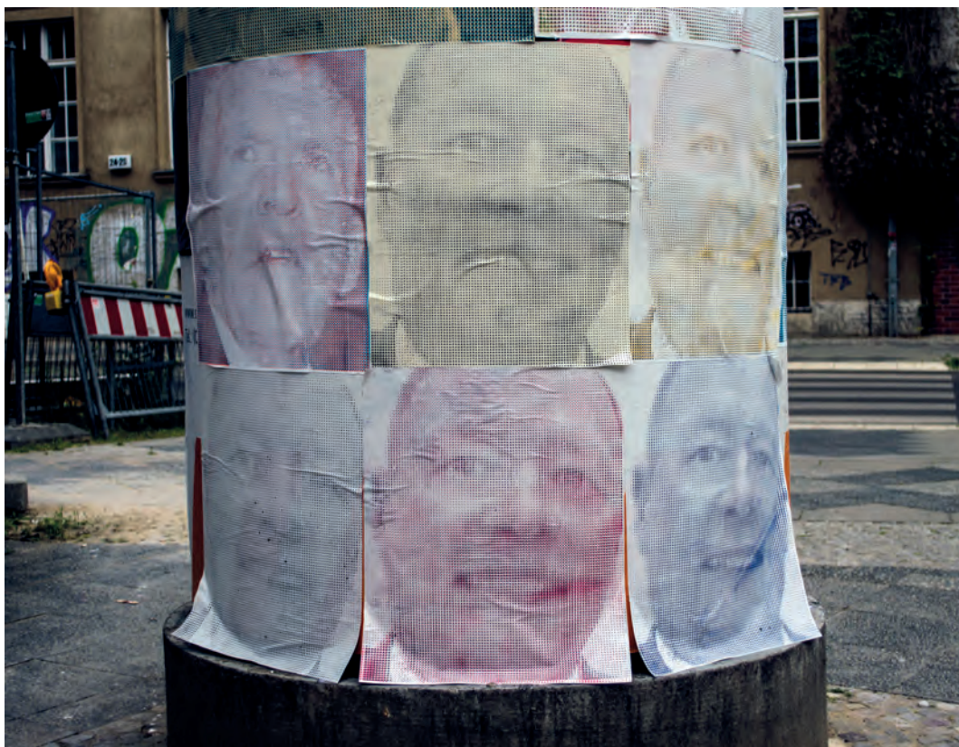
Pósters en una calle de Berlín, 2015