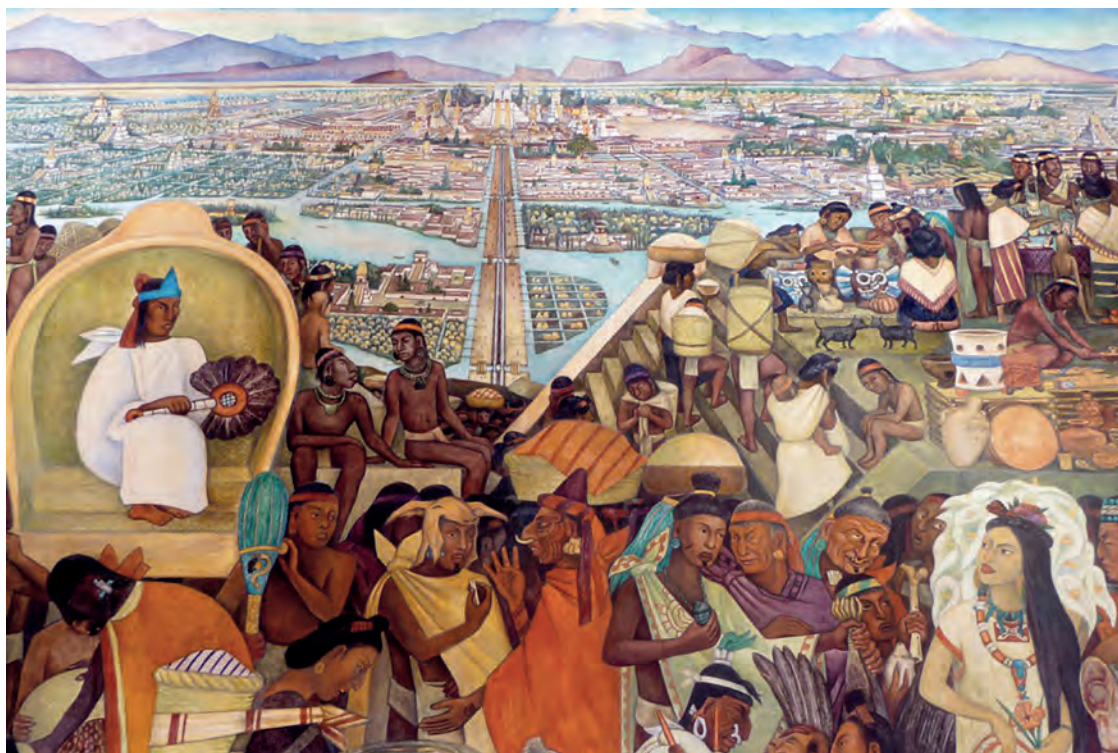
Diego Rivera, Tianquis en Tlatelolco, mural de Palacio Nacional, 1929-1935.