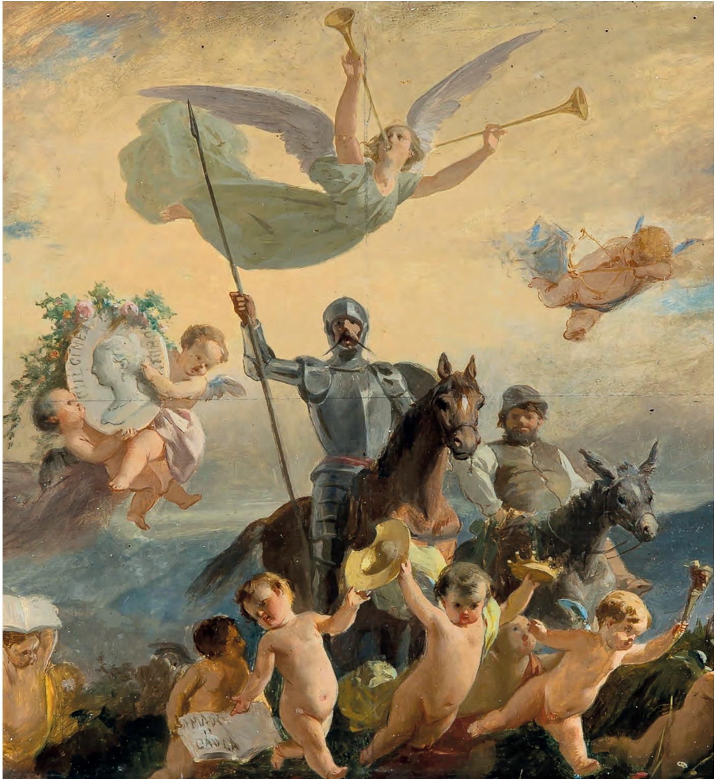
José Vallejo y Galeazo, Alegoría del Quijote , ca. 1870. Museo Nacional del Prado ©.