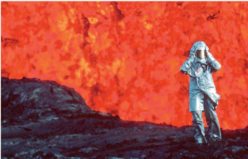
Fotograma de Fuego interior: réquiem para Katia y Maurice Krafft , 2022, Werner Herzog.