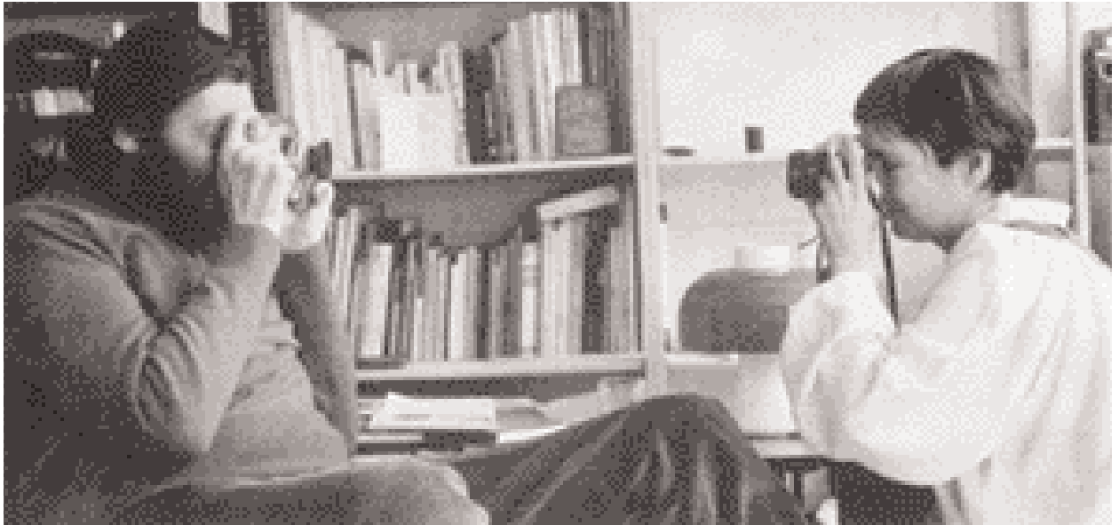
Con Carol Dunlop, Francia

Permítanme dar algunos ejemplos: el cuento más memorable de Poe sobre el apasionante tema del doble se titula “William Wilson”, en él se cuenta la historia de un joven cadete que comete una serie de delitos y maldades y que se ve asediado por otro joven del mismo nombre que le recrimina continuamente sus actos susurrándole al oído su propio nombre “¡William Wilson!”. Hasta que una noche de carnaval en Italia, a punto de perpetrar otra fechoría, Wilson enfrenta a su doble y con “ferocidad brutal” le atraviesa el pecho varias veces con su espada. Al desenmascararlo descubre que su antagonista es idéntico a él, como si se encontrara frente a un enorme espejo, aunque su rostro está pálido y cubierto de sangre. Antes de morir el doble alcanza a dirigirle a William Wilson las siguientes palabras, ahora ya en voz alta, como si estuviera hablando para sí mismo: “Me has vencido y desfallezco. Sin embargo de aquí en adelante tú también estarás muerto: muerto para el mundo, para la gloria y para la esperanza. Tú existías en mí y al morir, como podrás ver en esta imagen que es la tuya, comprobarás qué tanto te has asesinado a ti mismo”.