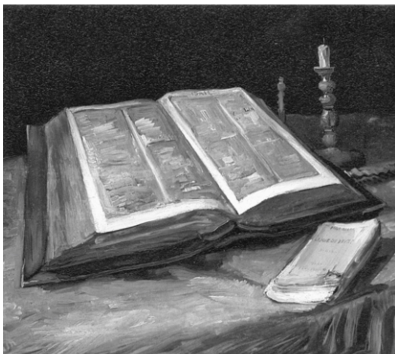
Vincent van Gogh, Naturaaleza muerta con Biblia , 1885