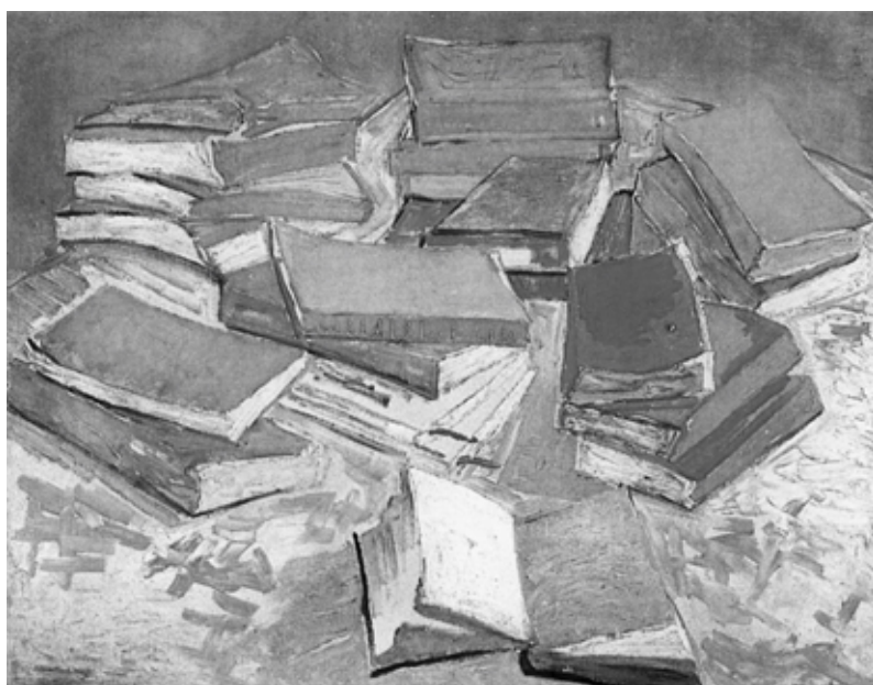
Vincent van Gogh, Naturaleza muerta con novelas francesas , 1888