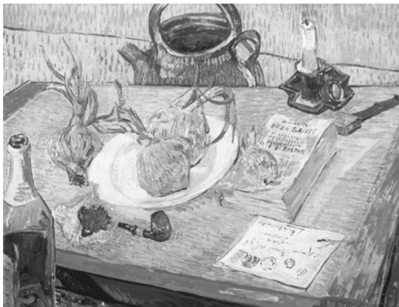
Vincent van Gogh, Naturaleza muerta con plato de cebollas , 1889