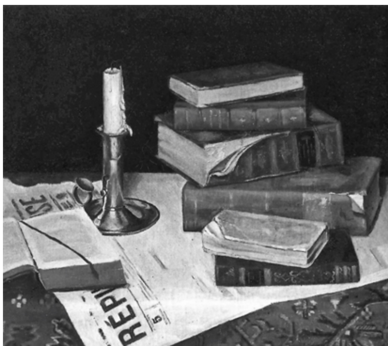
Vincent van Gogh, Naturaleza muerta con libros y vela , 1890