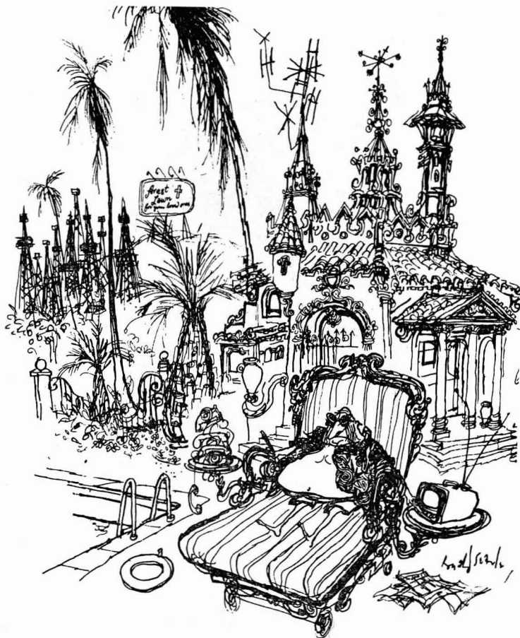
"gozar activa y felizmente de su trabajo y de su ocio"

Se les discrimina asimismo directamente, legal e ilegalmente, cuando buscan un hogar. Ésta es la razón de que los barrios negros sean los más sobrepoblados y ruinosos. En el Sur, el sistema conjunto de la enseñanza sigue segregándolos todavía en gran parte en escuelas inferiores. Y todos los demás actos de prejuicio y discriminación tienden a cohibir a los negros tanto económica como socialmente. En estos otros aspectos, la tendencia ha sido, como ya dije, de mejora a partir de prin-