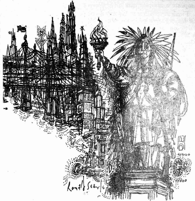
"una sociedad libre y abierta"

constituye realmente una parte integrante de la nación, sino un substrato inútil y miserable.