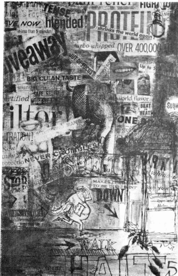
"cada vez más movilidad social"