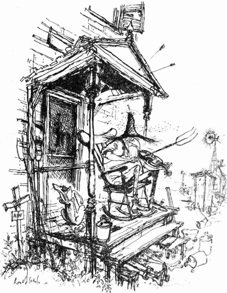
"un substrato inútil y miserable"

vuelto a pronunciarse en el sentido de que puede tolerarse un desempleo tan alto como el del 4 por ciento, aunque sin tener en cuenta, por lo visto, el desempleo de tiempo parcial y el subempleo a niveles de baja productividad.