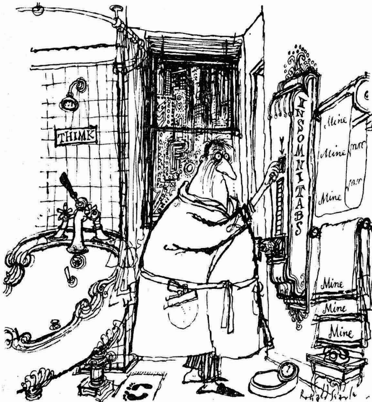
"sano de mente y de cuerpo"