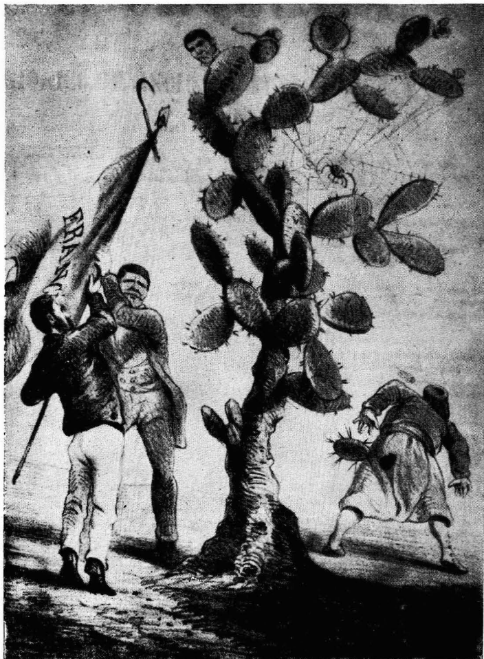
Ni por ésas...

Vencido el Imperio durante los últimos años del gobierno de Juárez sobreviene una paz, muy relativa, pero suficiente a permitir el progreso de la expresión literaria. Acaso la mejor síntesis de lo que pasó en la literatura durante aquellos años, es una página escrita el año 68 por el mismo Altamirano: ( De Resurgimiento literario. Una nueva generación ): "Decididamente la literatura renace en nuestra patria, y los días de oro en que Ramírez, Prieto, Rodríguez Galván, Carpio, Pesado, Fernando Calderón, Payno, jóvenes aún, iban a comunicarse en los salones de Letrán, hoy destruidos, sus primeras y her-