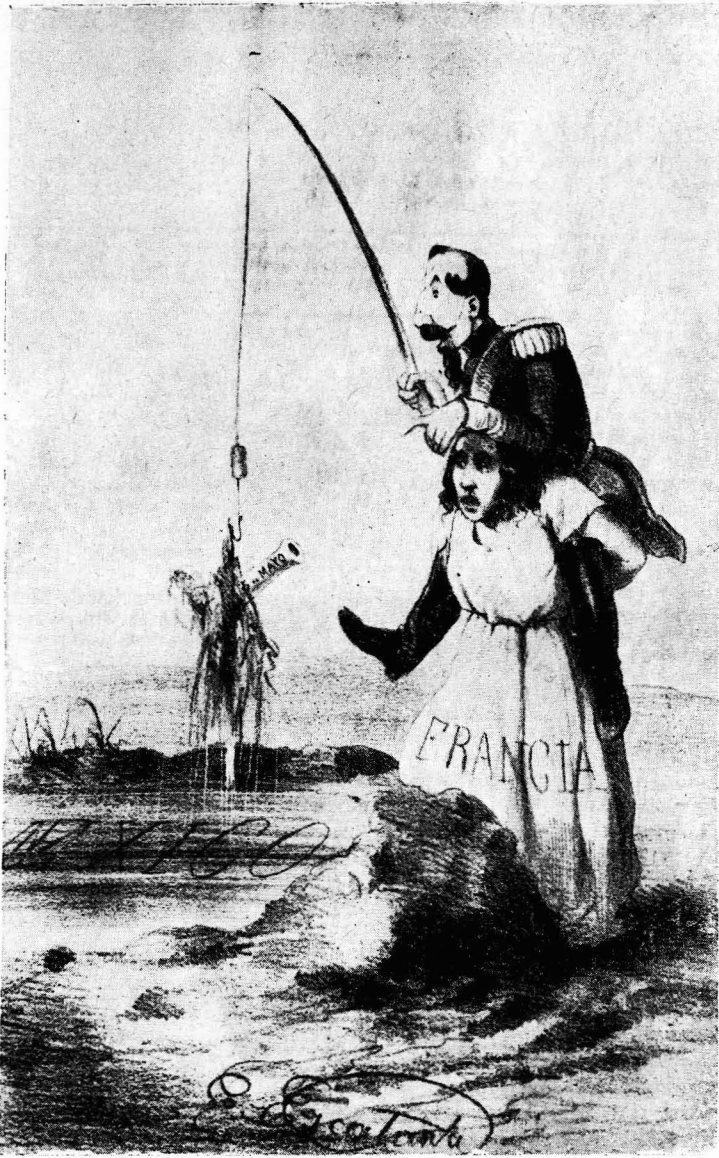
Al primer tapón, zurrapas

mosas inspiraciones, vuelven ya, por fortuna, para no oscurecerse jamás, si hemos de dar crédito a nuestras esperanzas. Aquel grupo de entusiastas obreros fue dispersado por el huracán de la política, no sin dejar preciosos trabajos que son hoy base de nuestro edificio literario.