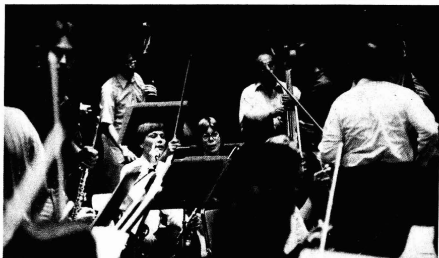
Orquesta Filarmónica de la Universidad