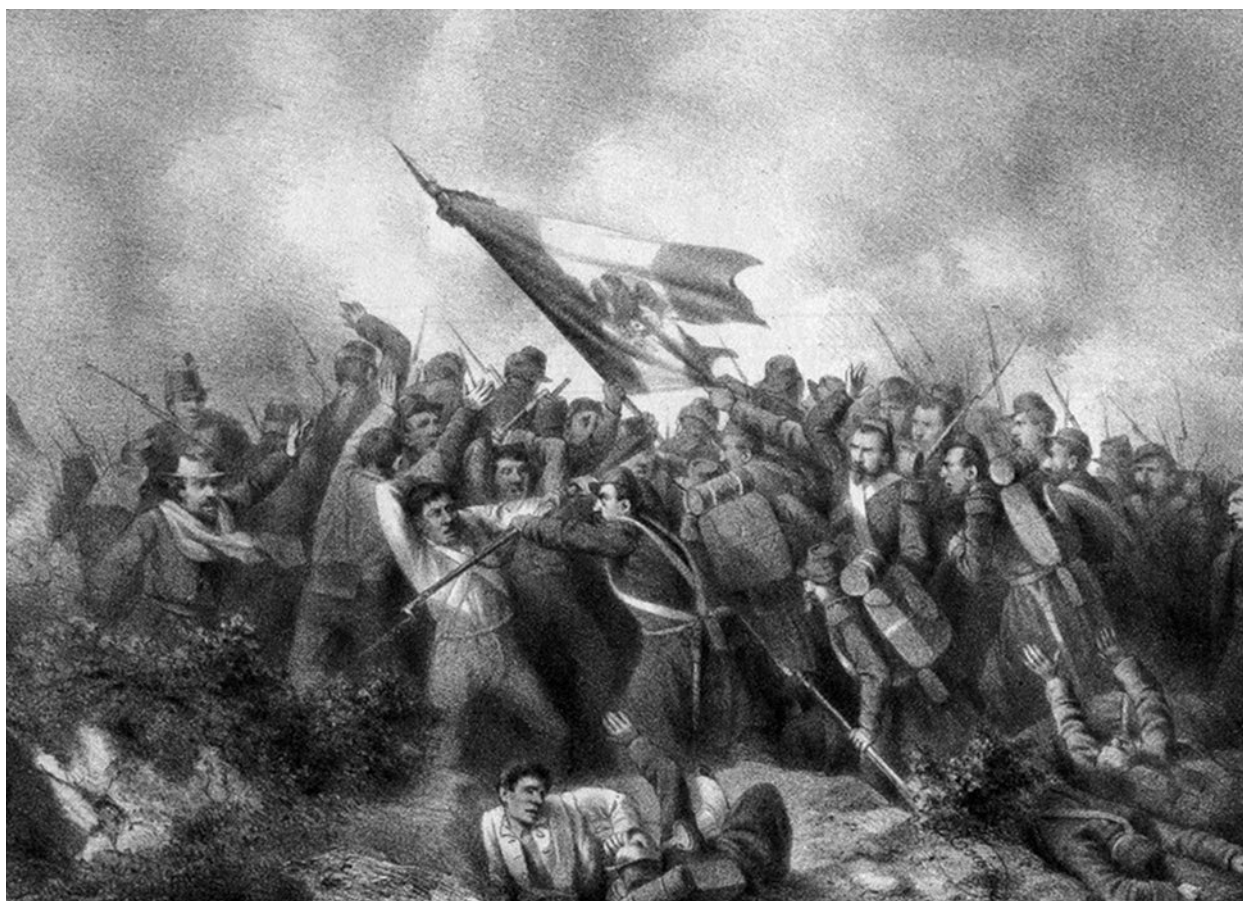
Estampa del México Independiente