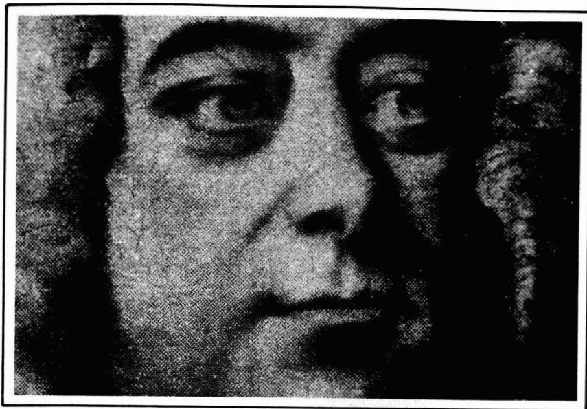
Georg Friedrich Händel

pues cinco años en Italia, y absorbió muchos parámetros del estilo musical italiano de la época, estilo que habría de quedar marcado en su música. Londres fue quizás el punto más importante en la vida y la carrera de Händel: su ópera Rinaldo producida con gran éxito, le introdujo al mundo de la nobleza inglesa, en donde halló generosos mecenas, incluso en la casa real. En 1726, Herr Händel cambió su nacionalidad y se convirtió en Mr. Handel. A lo largo de un par de décadas, produjo una treintena de óperas moldeadas al estilo de la ópera seria italiana, estilo en el que ciertos personajes de la historia o de la mitología eran presentados en una secuencia de arias estáticas, unidas por recitativos. Al margen del evidente éxito de sus óperas, Händel no fue ajeno a las típicas intrigas de rivales envidiosos, mecenas volubles y cantantes temperamentales; tales intrigas afectaron incluso su salud, y durante una de sus convalecencias, el compositor tuvo una idea brillante. Hacia 1732, el Obispo de Londres había prohibido la representación escénica de temas sagrados, y al mismo tiempo, el público parecía haberse hartado de la artificialidad de la ópera. Así, Händel decidió tomar un nuevo curso: se dedicó a partir de entonces, con su tradicional energía, a la producción de oratorios: Saúl , Israel en Egipto , Sansón , Judas Macabeo , Salomón , Jefté . Con esta serie de oratorios, Händel alcanzó tanto éxito como con sus óperas, éxito que culminó con el Mesías , que hasta la fe-