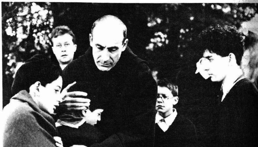
Adiós a los niños, de Louis Malle

Se trata de las más recientes producciones de John Boorman, inglés, y de Louis Malle, francés. Ambos, a pesar de sus diferencias, comparten la experiencia de una infancia marcada por la guerra y en esta ocasión, ambos eligieron para sus respectivas obras, un punto de partida semejante: los recuerdos de sus vivencias infantiles durante la guerra de papá.