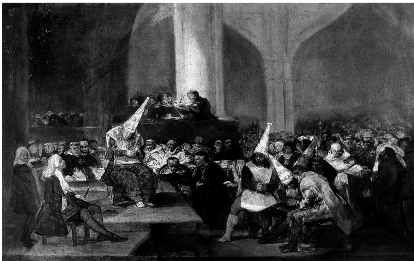
Francisco de Goya, Tribunal de la Inquisición , 1819

¿Qué más podemos añadir a esta revisión, producto de una grata lectura? El libro de José Iturriaga está escrito con el rigor de una alternancia cronológica que, desde el punto de vista de la estructura corresponde a los distintos momentos de cada uno de los personajes. En el orden de las ideas constituye una declaración de principios respecto del tema de la dignidad del indio y del mestizo y los atentados en su contra; la reivindicación del amor y del sexo como expresiones humanas legítimas y la evidencia de la opresión femenina en el interior de cárceles conventuales erigidas por un orden patriarcal. Y, también, que es una “novela de época” que entretiene e instruye; a un tiempo, dulce y útil. u