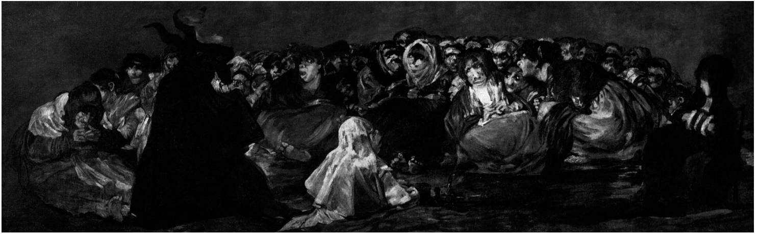
Francisco de Goya, El aquelarre , 1797-1798

Brígida, con su carga de sensualidad, en cierto sentido emisaria del diablo tan temido y encarnación del mestizaje; Jesús, muestra del sincretismo religioso que determina una identidad marcada por la confusión; Marcelina, arquetipo de religiosa como las de las numerosas biografías de monjas que se escribieron en la Colonia. Por último, un personaje secundario en la trama pero de prosapia en nuestra cultura: Hernando Ruiz de Alarcón, cura del partido de Atenango, cercano a Iguala, hacia los años de 1618-1620 y hermano del dramaturgo Juan, quien se exiliaría en España. Juan, el hermano bueno pero socialmente incómodo por aquello de la doble joroba que atraía burlas y escarnio; Hernando, el hermano inteligente y malo. Se le ha llegado a considerar uno de nuestros primeros antropólogos involuntarios. Me detengo en el cura Hernando y en la monja Marcelina.