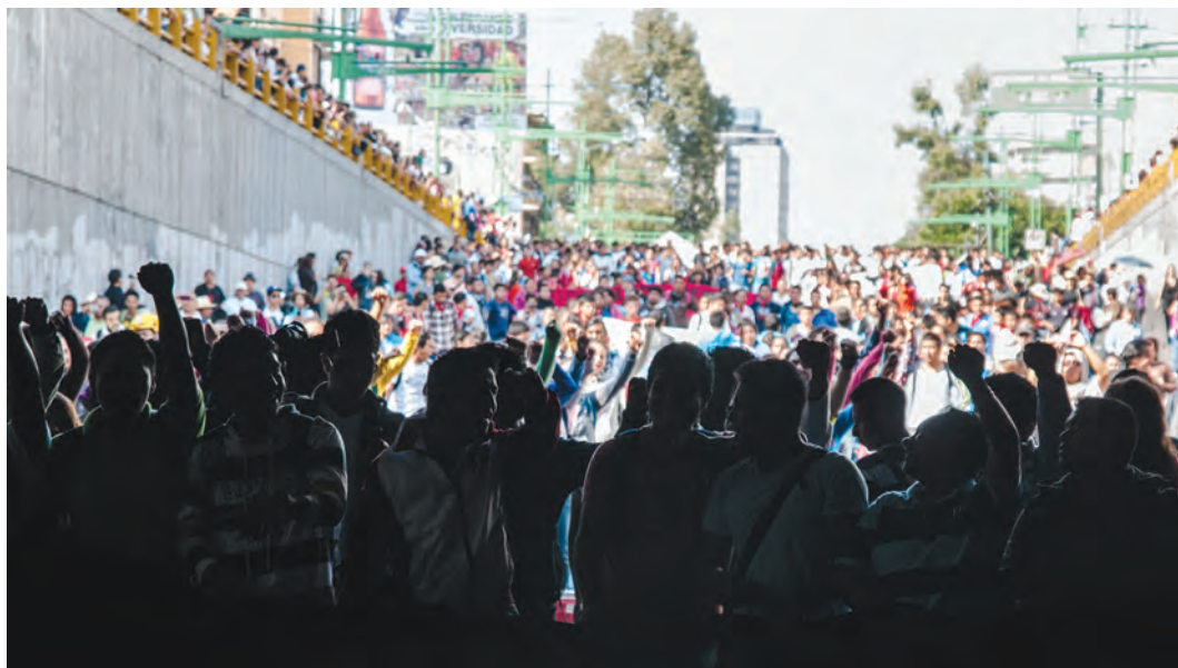
Contingente de la Normal Rural de Ayotzinapa en la marcha del 2 de octubre en la Ciudad de México.

puesta y la totalidad de esta agenda, conocida como Justicia Transicional, han sido abandonadas por el actual gobierno.